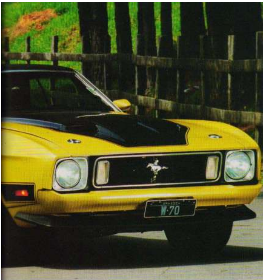
LINHA MACH 1: SUPRA-SUMO DOS MOTORES - 400 CAVALOS DE POTÊNCIA E ESTRELA DA PRIMEIRA VERSÃO DO FILME 60 SEGUNDOS (1974)