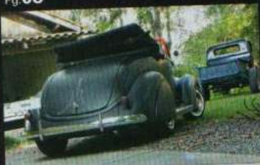
Ford 1937 ATIVISTA DO HOT