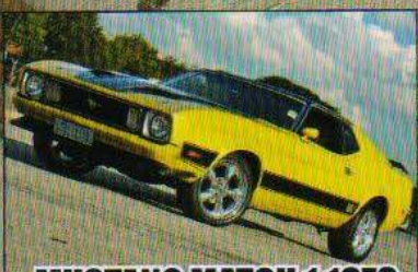
MUSTANG MATCH 1-1973

ANO 4 # 42 R$ 9,90 ISSN 1808-9299 9 771808 192071