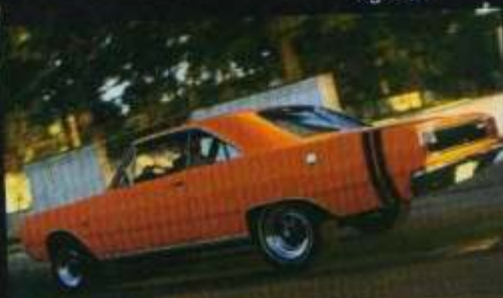
Dodge Dart 1970 MOPAR DIABÓLICO