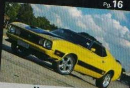
Mustang Mach 1 1973 O VERDADEIRO ELEANOR