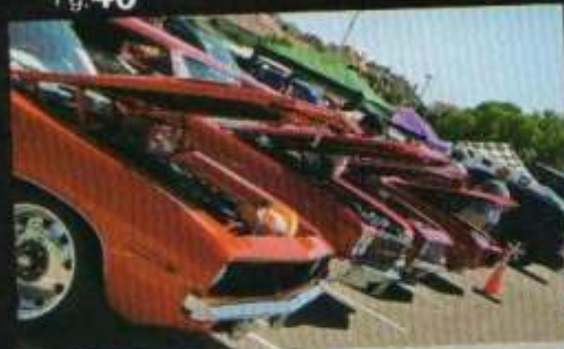
Evento 1 MUSCLE CAR IN DALLAS