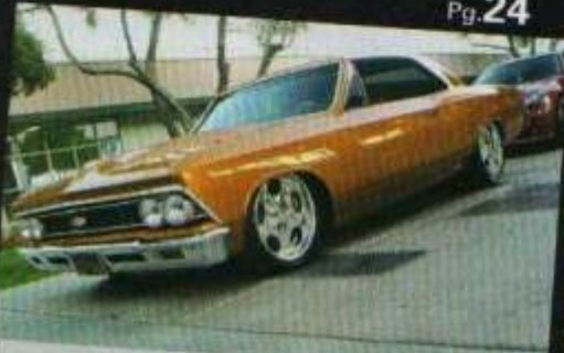
Chevelle 1967 COMO NOS VELHOS TEMPOS