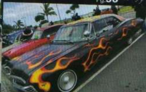
Evento 2 DA TERRA DOS CANGURUS